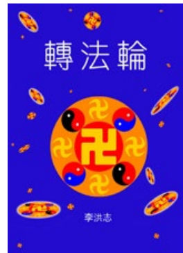
中文版《转法轮》封面

近日被披露的这条消息，说明中国现任当权者在向人们释放在中国修炼法轮功合理合法的信号；说明江泽民团伙对法轮功的迫害已走向末路，面临被清算的结局。