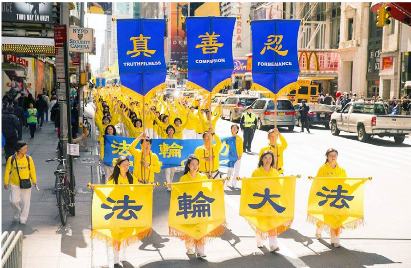
■ 2017 年 5 月 12 日，近万名法轮功学员组成的游行队伍横贯纽约曼哈顿。