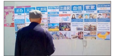
中国大陆街头的“法办江泽民”招贴

据明慧网 2017 年 5 月 5 日报导，大陆一些公检法人员明白真相后，不再参与迫害法轮功。山东青岛一起构陷法轮功学员的案件，转到即墨检察院后，多次被退回公安机关，公安机关换个罪名又诉至即墨法院。后因即墨法院法官对此案全体回避，该构陷案被青岛市中院指定移交到平度检察院。