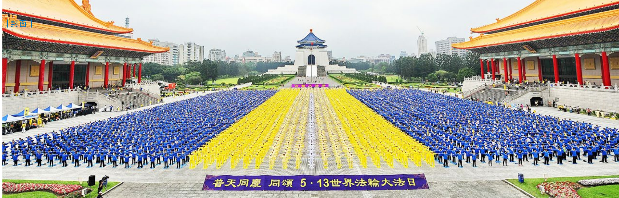
■ 5月13日是世界法轮大法日，全球法轮功学员每年都举行庆祝活动，上图在台湾。