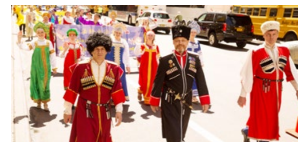
■ 身穿节日盛装的各族裔法轮功学员