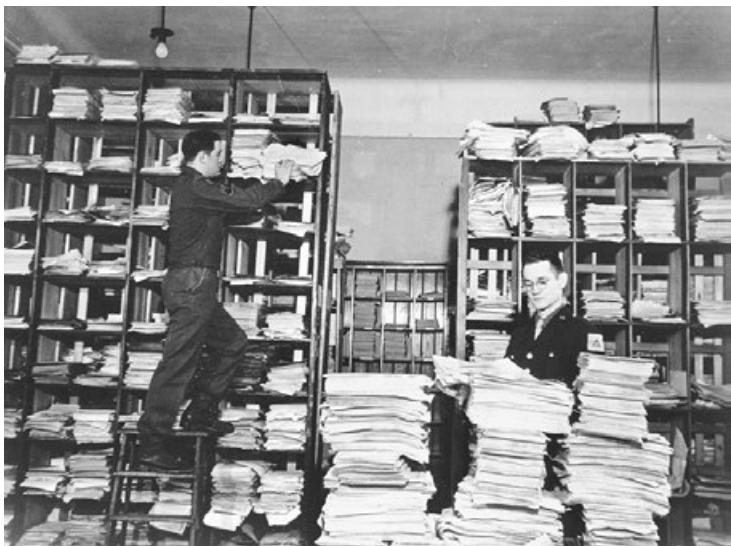
纽伦堡审判时期，工作人员在甄选大量的德语文件，这些文件由调查员收集。昔日的上级指令与层层执行者的签名，日后成为纳粹官员们的犯罪证据。