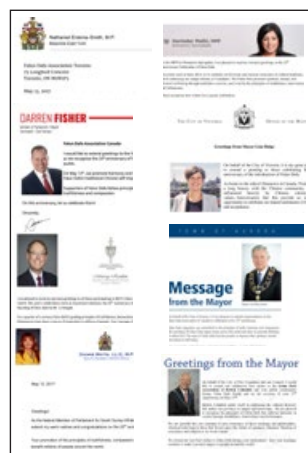
■ 加拿大政要的部分贺信

2017 年 5 月 13 日法轮大法传世 25 周年之际，北美政要纷纷发贺信，赞扬法轮大法给世界带来福祉，赞扬法轮功学员坚持实践“真善忍”的价值观，为社会做出贡献。