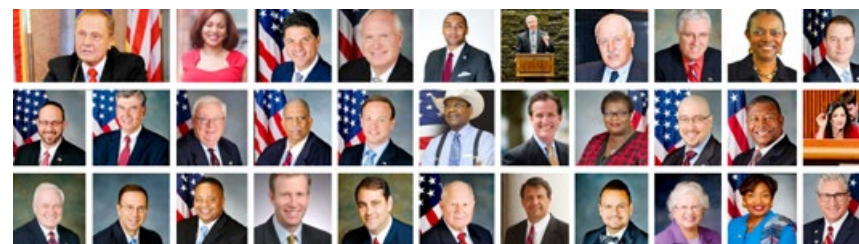
■ 决议案由纽约州参议员约翰·博纳西奇发起，31 名参议员共同提议。

加拿大多名国会议员、省议员和市议员发出贺信恭贺法轮大法日，他们赞扬法轮大法的教导打动了无数世人的心，由衷感谢法轮功修炼者坚持不懈地与世人分享“真、善、忍”的价值观，并表示“真、善、忍”的重要性已经获得加拿大的肯定和认同。其中加拿大首都渥太华市市长吉姆·沃森连续第七年代表市议会宣布 5 月 13 日为“渥太华法轮大法日”。◇