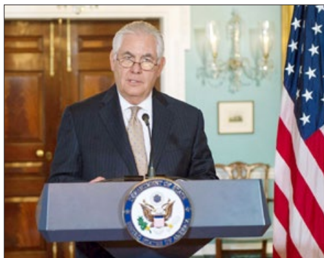
2017 年 8 月 15 日，美国国务卿蒂勒森“2016 年宗教自由报告”发布会上。

【明慧网】美国国务院于 2017 年 8 月 15 日发布 2016 年《国际宗教自由报告》，关注全球信仰自由状况。中国与另九个国家因存在严重宗教迫害问题，被列为“特别关注国”。美国国务卿蒂勒森（Rex Tillerson）对中共迫害信仰人士的行径表示关注。他在新闻发布会上提到，2016 年有数十名法轮功修炼者在被关押期间死亡。