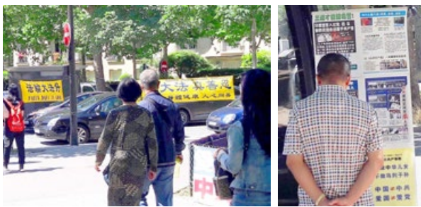
法国巴黎，游客经过法轮功真相点，了解真相。

进入2017年夏季，来法国巴黎旅游的中国大陆游客日渐增多。在这个国际大都会的旅游景点，每天都有法轮功学员设立真相点，向同胞们讲述中共迫害法轮功的真相，让游客带回国的不仅是名牌商品，还有“三退”（退党、退团、退队）后的平安与美好。