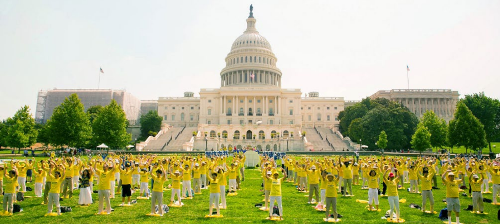
2017 年 7 月 20 日，美国首都华盛顿，国会山前，法轮功学员集体炼功。

“法轮功学员在被迫害中体现出尊严、善良和慈悲，甚至对迫害者同样报之以慈悲。他们为所有人树立了无与伦比的典范。”◇