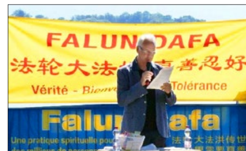
瑞士日内瓦州大会议员亨利·拉帕，2017 年 7 月 20 日在当地法轮功学员的集会上表示：“我们会继续用一切手段制止迫害，还法轮功清白。”