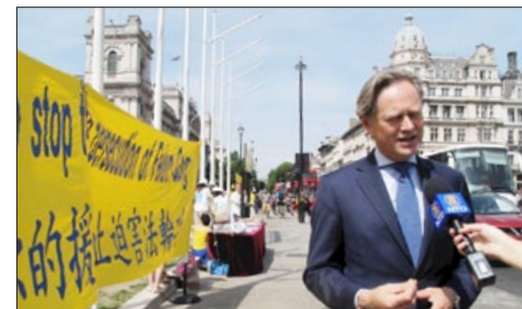
英国国会议员马修·奥佛德，2017 年 7 月 18 日在英议会大厦前支持法轮功，他说：迫害应该立刻被制止。