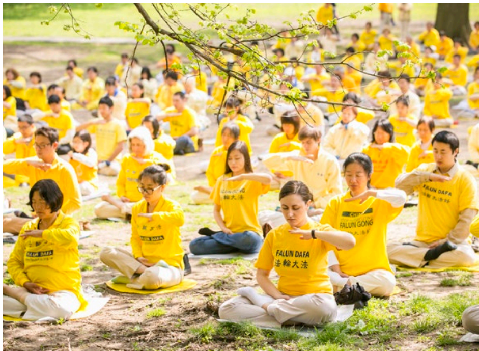
海外法轮功学员在公园里炼功