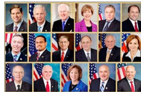
美国国会多位参议员、众议员在法轮功学员反迫害 18 周年之际致信声援。

瑞士 50 多名国会议员和州议员在给联合国高级人权专员 Zeid Ra'ad Al Hussein 先生的呼吁信上签名，支持法办迫害法轮功的元凶江泽民，要求中共停止迫害法轮功。签名原件已在 2017 年 7 月 20 日递交联合国高级人权专员办事处。◇