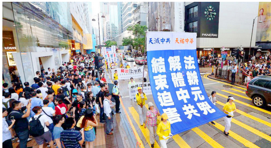
2017年10月1日，香港法轮功学员举行反迫害大游行。

使全国彻底腐败。政法委、‘六一零’非法组织常态化调动警力暴力迫害无辜民众，对修炼‘真善忍’的法轮功学员非法关押，制造大量冤假错案，引发天怒人怨。现在人们的生存环境，被江泽民及其培养的腐败官员全面破坏。人们吃的喝的是毒，穿的住的是毒，喘口气也吸毒，生活在无毒不在的环境中，不生病才怪呢。”