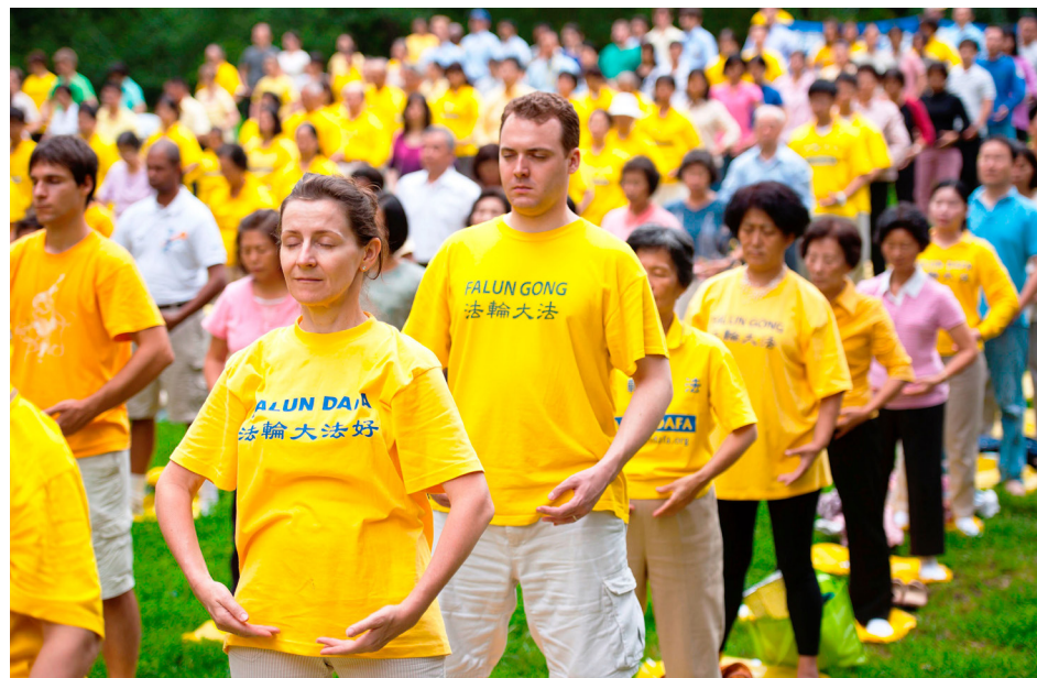
海外法轮功学员集体炼功

弘传世界 法轮大法已弘传100多个国家和地区，受到世界人民的爱戴和尊敬。李洪志先生和法轮大法因对人类身心健康做出的杰出贡献，获各国政府褒奖、支持议案和信函3500多项。法轮功书籍被译成39种语言在全球出版发行并可在法轮大法网站上免费下载。◇