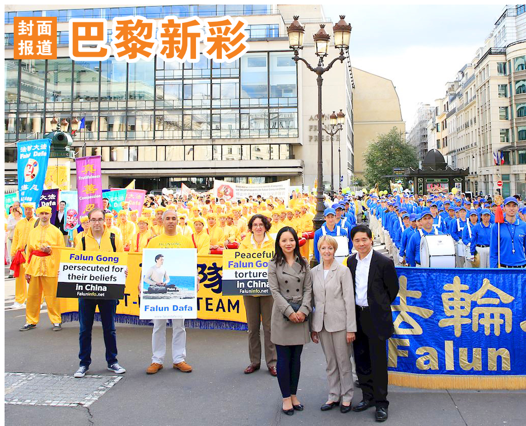
法国前部长奥斯塔丽女士（中）与法轮功学员合影