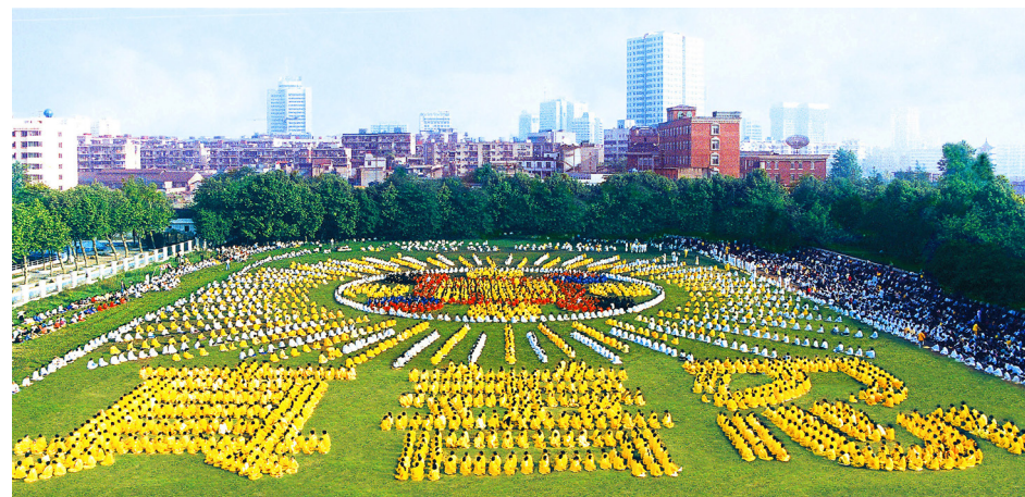
1997年，5000多名武汉法轮功学员炼功，列队组成法轮图形及“真善忍”。

1999年12月，中共头目江泽民签订《国界叙述议定书》，出卖了344万平方公里的中国领土。这些土地，是清朝末年因不平等条约割让给沙俄的。按照国际法，可以如香港和澳门一样回归。