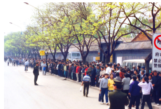
1999年4月25日，上万名法轮功学员和平上访，向当局反映法轮功的真实情况和发生在天津的公安暴力抓捕法轮功学员事件。整个上访过程秩序井然，法轮功学员离开后，地上无一片纸屑。有警察感慨地说：“看，这就是德！”

江泽民明确发出取缔法轮功的指示。这个决定非常突然，而且与国内安全情报部门的调查结论相悖。安全部门的调查结论是“法轮功不构成任何威胁”。