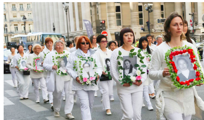
纪念被中共迫害致死的 4154 位中国大陆法轮功学员

她表示，法轮功是平和、传统、有着古老承传的功法，让修炼者获得身心健康。她揭露江泽民一意孤行发动了残酷的迫害，大量法轮功学员被酷刑、杀害，甚至被活体摘取器官。她严正要求停止迫害法轮功，将迫害者绳之以法。她坚信，由于法轮功学员的努力，正义和自由将赢得胜利！