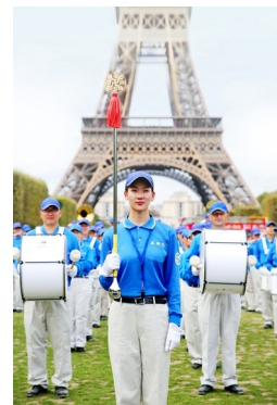
法轮功学员组成的天国乐团