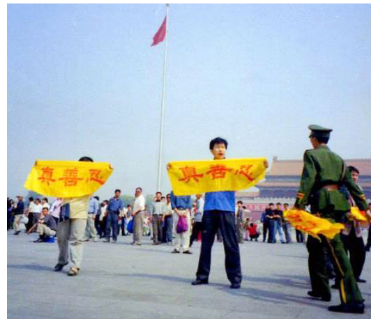
天安门广场一幕（2001年5月13日）

在法轮功被迫害初期，许多人到当地政府部门请愿。当他们看到低层地方官员毫无反应，就开始给更高层政府写信，或到北京请愿。到了2000年，几乎每天都有法轮功修炼者在天安