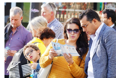
观众阅读法轮功真相资料

她表示，法轮功是平和、传统、有着古老承传的功法，让修炼者获得身心健康。她揭露江泽民一意孤行发动了残酷的迫害，大量法轮功学员被酷刑、杀害，甚至被活体摘取器官。她严正要求停止迫害法轮功，将迫害者绳之以法。她坚信，由于法轮功学员的努力，正义和自由将赢得胜利！