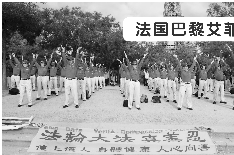
↑ 法轮功学员在艾菲尔铁塔前集体炼功