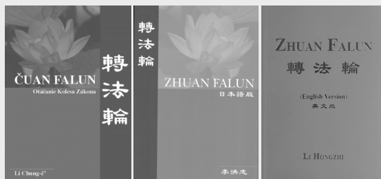
↑ 《转法轮》斯洛文尼亚文版、日文版、英文版封面

“天梯书店”有售：《转法轮》已被翻译成 40 种语言，是迄今为止翻译成外国语言文字最多的中文书籍，在世界各地的法轮大法书籍专营店“天梯书店”都可看到。