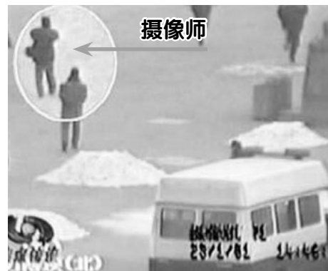
↑ 图为央视“焦点访谈”录像截图