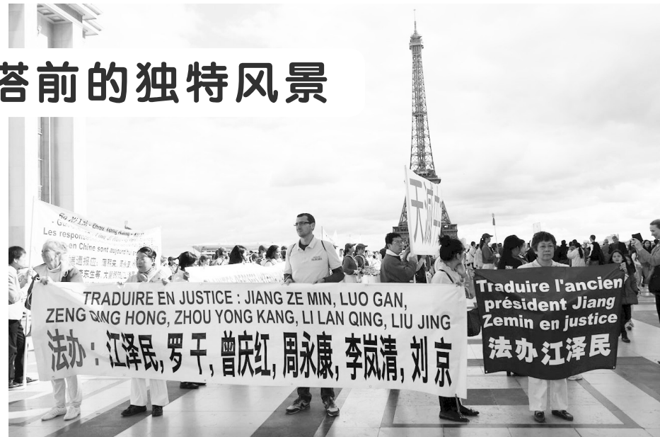
↑ 法轮功学员艾菲尔铁塔前集会