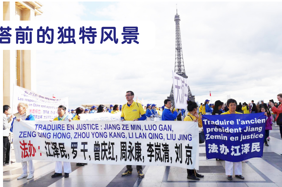
↑ 法轮功学员艾菲尔铁塔前集会