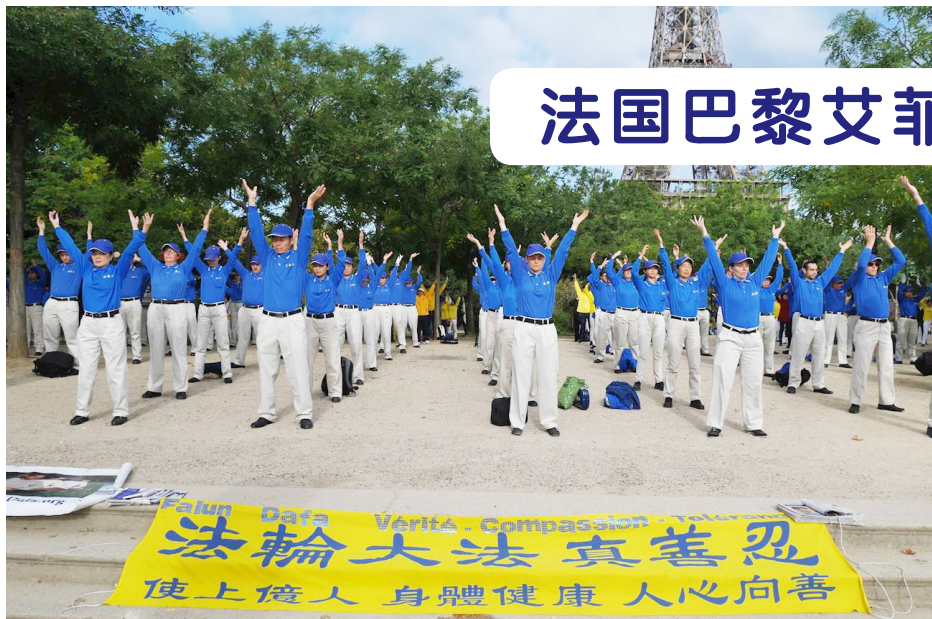
↑ 法轮功学员在艾菲尔铁塔前集体炼功