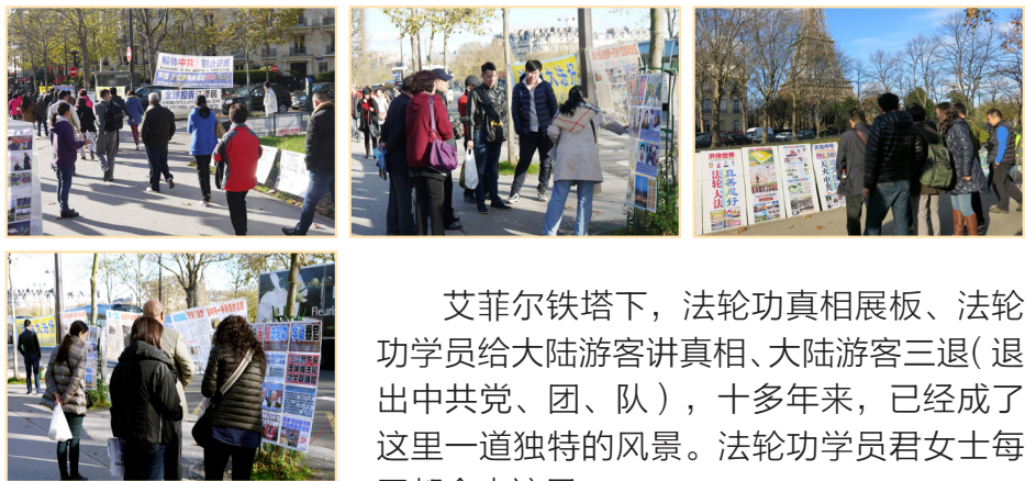
↑ 艾菲尔铁塔前的真相展板，游客或驻足观看，或听讲解。

艾菲尔铁塔下，法轮功真相展板、法轮功学员给大陆游客讲真相、大陆游客三退（退出中共党、团、队），十多年来，已经成了这里一道独特的风景。法轮功学员君女士每天都会来这里。