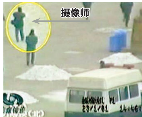
↑ 图为央视“焦点访谈”录像截图