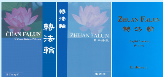
↑ 《转法轮》斯洛文尼亚文版、日文版、英文版封面

“天梯书店”有售：《转法轮》已被翻译成 40 种语言，是迄今为止翻译成外国语言文字最多的中文书籍，在世界各地的法轮大法书籍专营店“天梯书店”都可看到。