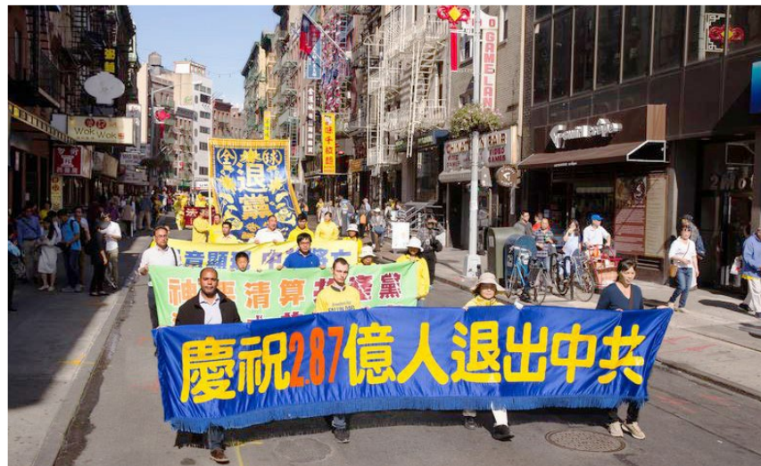
↑ 2017年10月22日，美国纽约曼哈顿游行，声援2.8亿人三退。

2017年大年过后，表哥表嫂来到我家，用U盘复制了法轮功的主要著作《转法轮》和其他法轮功书籍。表哥说：“想一想还是应该炼法轮功。回去会把法轮功的书全看了。我这个岁数，没有别的追求了，官场一切看透。我身体不好，有些病不是医院能治的，人的生命也不是自己想象的。法轮功值得研究，我要好好学一学。”