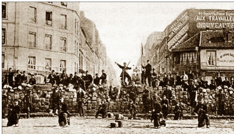
1871年3月18日，巴黎公社在巴黎城内设置的路障。