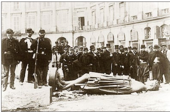
巴黎公社于 1871 年 5 月摧毁了纪念拿破仑胜利的旺多姆圆柱，柱顶的拿破仑塑像也被毁。

当时身居巴黎的人们都见证了，巴黎公社社员是破坏成性的一群流寇，他们实行报禁，把给国王宣讲的达尔布瓦大主教抓作人质枪毙，暴杀教士，摧毁名胜古迹，以此为快事。