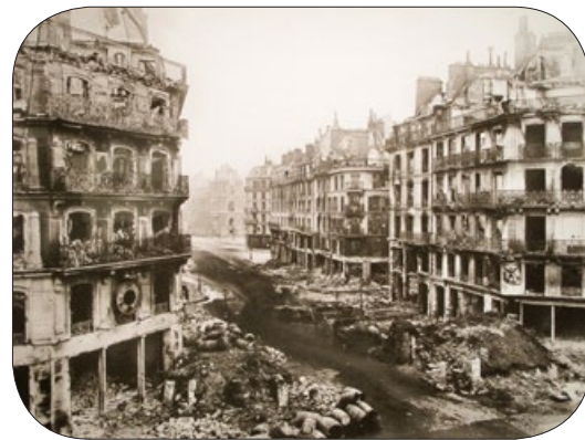
法国首都巴黎，富丽甲天下。巴黎公社暴乱过后，华美的楼台化为灰土。