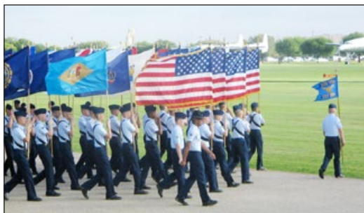
美军空军基本训练营毕业典礼