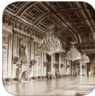
法国皇宫——杜伊勒里宫一角。 整个宫殿被巴黎公社焚毁。

1871年5月，暴乱的巴黎公社遭到法国政府军队的打击，5月28日，巴黎公社在巴黎城内设置的最后一个路障被政府军攻下。