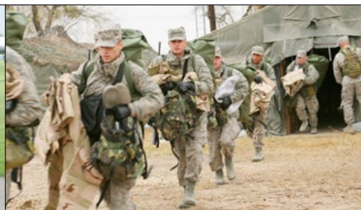
新兵参加空军基本训练