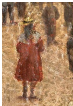
◀印象派油画《布里昂松市大雨漏街的活跃街景》局部。此画作于 1870 年左右，作者不详。画面因技法不合理已经严重变色开裂。

导“创新”精神，强调表达自我个性，不喜欢做别人做过的事。同时，当代艺术思潮中的“前卫”、“解构主义”等观念造就了大量反传统、反正统心态的人。很多学画者也高举“创新”的大旗，抛弃旧有的一切。