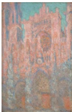
◀印象派代表画家莫奈的《鲁昂大教堂》，作于 1893 年。作者要表现阳光下大教堂的颤动光色，但由于背弃了传统技法，不但画面严重发灰，而且现在整幅画已布满裂痕。