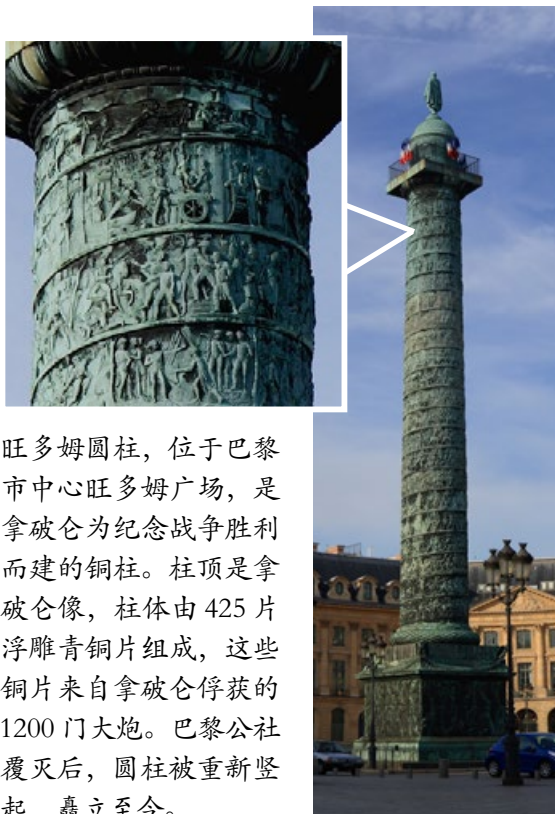
旺多姆圆柱，位于巴黎市中心旺多姆广场，是拿破仑为纪念战争胜利而建的铜柱。柱顶是拿破仑像，柱体由 425 片浮雕青铜片组成，这些铜片来自拿破仑俘获的 1200 门大炮。巴黎公社覆灭后，圆柱被重新竖起，矗立至今。