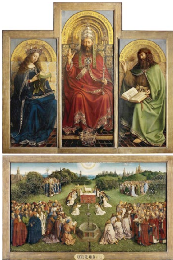
凡·艾克 (Van Eyck) 兄弟的《根特祭坛画——神秘的羔羊》(局部)。整幅祭坛画约 343×440 厘米，作于 1415 年~1432 年，题材取自圣经《启示录》，表达了对神在末世时慈悲救众生的赞颂。画中“树脂油多层罩染技法”的出色运用与静谧精细的写实风格，让此画成为油画史上最为重要的杰作之一。

绘制这样的作品，在心境上要有足够的定力，技巧上需要长期经验的积累，材料运用上必须符合自然法则。只有如此，作品才允许保存到流芳百世。