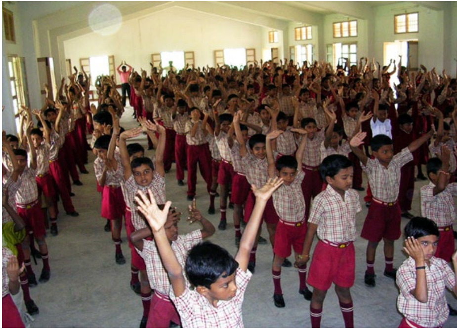
▲印度学校 ST.ANNS SCHOOL 的学生在集体炼法轮功。

世 15 年之后，共有 40 种语言版本，被世界各族裔人民阅读。《转法轮》开篇文章《论语》的英文版被印度的学校列入学校教材。