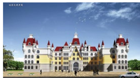
▲ 张泽设计作品——幼儿园