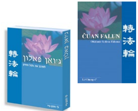
▲希伯来语和斯洛伐克语《转法轮》