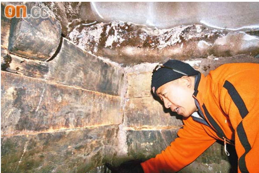
▲探索队员在木结构方舟内

2010年4月28日，一支由香港人和土耳其人组成的探索队在北京宣布：他们日前在土耳其东部的亚拉腊山（《圣经》记载的阿勒山）海拔超过4000米处发现了诺亚方舟遗迹，并成功进入巨型木结构的方舟内，探索队员还在方舟内发现了陶器、绳索以及类似种籽的物体。船的残骸里发现有不少带有木梁的小隔间，显然是用来供各种动物栖息的。