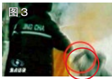
图 3 用手摸头，突然倒地