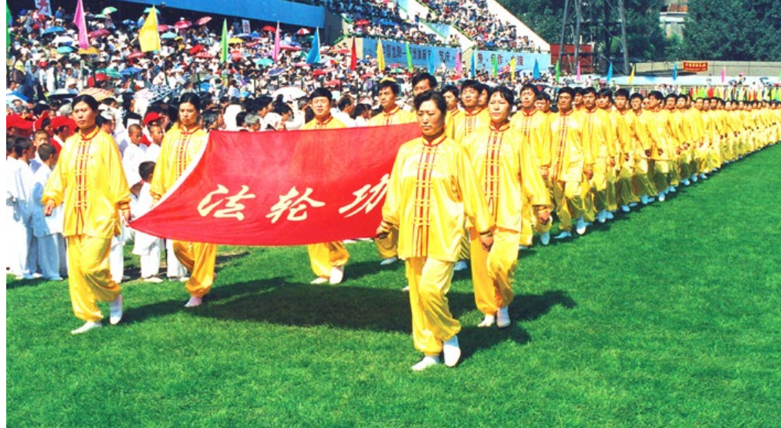
▲ 1998年8月，沈阳市法轮功学员受邀参加亚洲体育节开幕式，法轮功学员列队入场。

是啊，自从沈医师修炼法轮大法后，脾气越来越好，涵养越来越高，再也不自我，并能为他人着想。对照他前后判若两人的个性和人生观的转变，真令人赞叹法轮大法“真、善、忍”法理的力量与神奇。◇