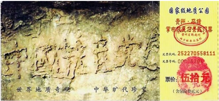
▲国家级地质公园贵州·平塘掌布乡石景区门票，以“亡共石”照片作招牌

5000 年前，耶和华决定惩罚败坏的人类，告诉诺亚造方舟躲过劫难。5000 后的今天，当人类进入十恶毒世，神再次决定给人以惩罚的时候，神佛用这种特殊的方式，向人们发出了慈悲的警示，希望人类能明白真相从而做出正确的选择。