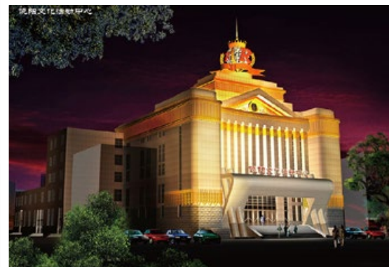
▲ 张泽设计作品—— 饶阳影院夜景