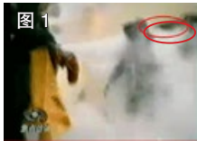
图 1 凶手猛击刘的头部