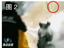
图 2 一条状物弹起