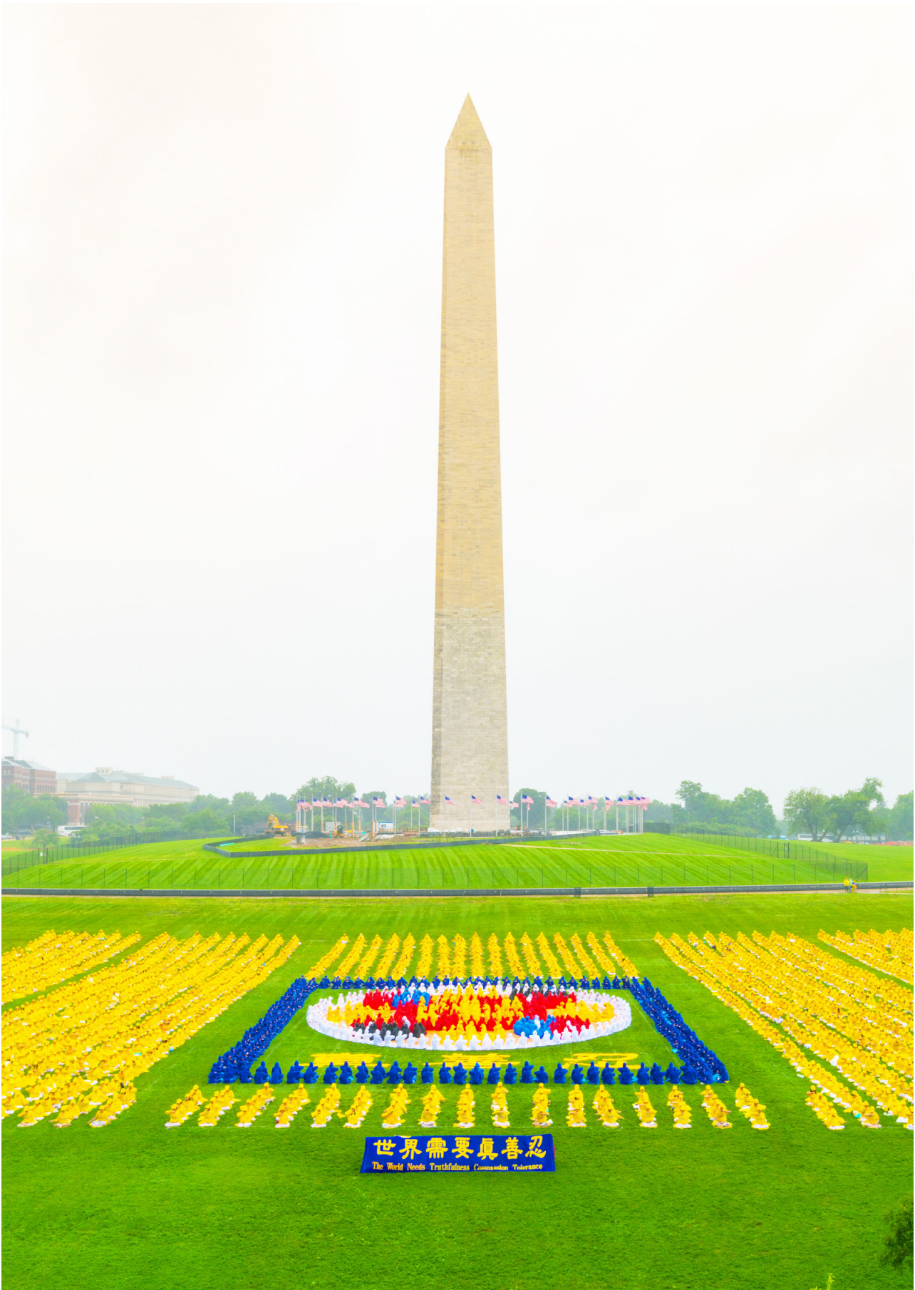
▲ 2018 年 6 月 22 日上午，数千名来自加拿大、澳洲、新西兰、台湾、香港、澳门等地的法轮功学员在华盛顿纪念碑前举行了集体大炼功活动并排出庄严的法轮图形。

汉文帝的一生，以黄老之道治理天下，崇尚“无为而治”，以德化民，最终开创了中国古代历史上有名的盛世——“文景之治”。◇