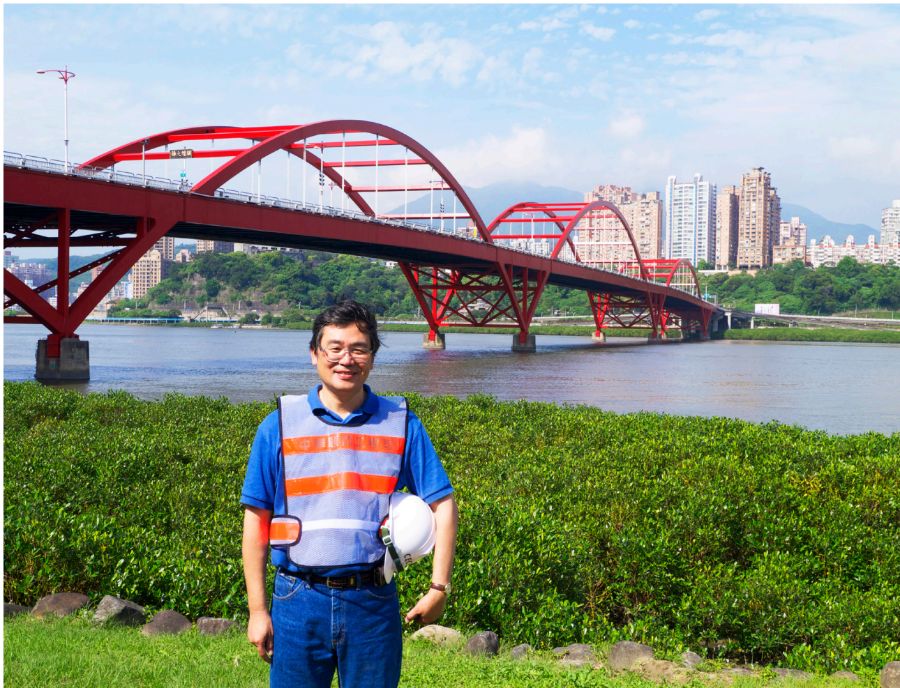
▲ 1995 年王仲宇与数名中央大学教授创建了台湾第一个桥梁工程研究中心。

在台湾有这么一位“医生”，他不仅看病，还“算命”——专门算桥梁的寿命。他就是拥有 28 项专利发明、以“桥梁医生”自居的台湾国立中央大学土木系教授王仲宇。王仲宇参与创建了台湾第一所桥梁工程研究中心，20 多年来他带领研究团队检测、监测台湾的桥梁健康状态，守护着台湾桥梁的安全。