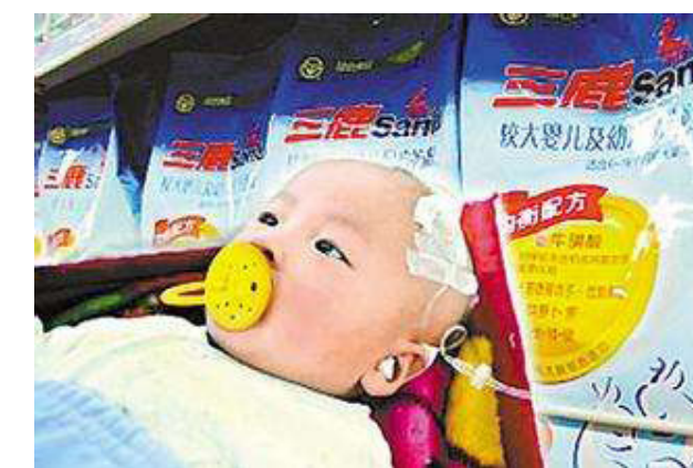
▲ 三鹿奶粉导致很多服用的婴儿患有结石。

这次毒疫苗曝光的导火索是长生公司的一名员工实名举报该公司疫苗生产存在造假才引发的。