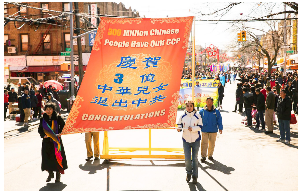
▲ 2018年3月13日纽约法轮功学员庆祝3亿人退出中共党、团、队等组织。

作为中国公民, 即使参与政治也是正常的, 法院判决中不是常带有“剥夺政治权利”这一条吗? 那么, 只要人们没有被“剥夺政治权利”, 那他即使参与政治也是正当的。不过, 劝人“三退”(退出中共党、团、队组织) 完全不是参与政治, 而是在救人的命。