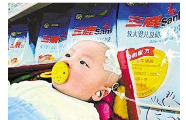
▲ 三鹿奶粉导致很多服用的婴儿患有结石。

这次毒疫苗曝光的导火索是长生公司的一名员工实名举报该公司疫苗生产存在造假才引发的。