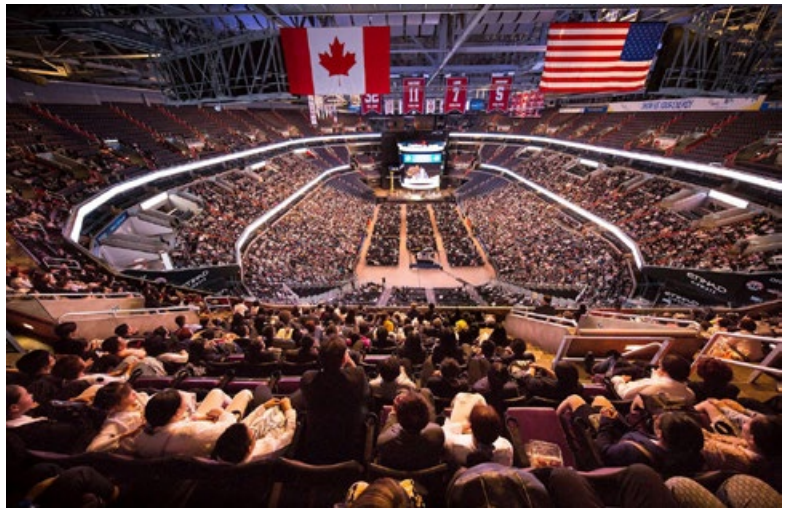
▲ 2018年6月21日，来自全球56个国家的近万名法轮功学员，参加“华盛顿DC法轮大法修炼心得交流会”，并聆听法轮功创始人李洪志先生的讲法。