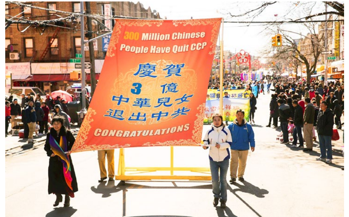
▲ 2018年3月13日纽约法轮功学员庆祝3亿人退出中共党、团、队等组织。

作为中国公民，即使参与政治也是正常的，法院判决中不是常带有“剥夺政治权利”这一条吗？那么，只要人们没有被“剥夺政治权利”，那他即使参与政治也是正当的。不过，劝人“三退”（退出中共党、团、队组织）完全不是参与政治，而是在救人的命。