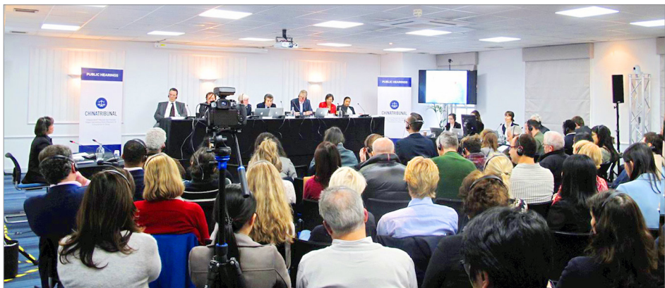
“独立人民法庭”在伦敦举行听证会，就中共强摘良心犯器官指控开庭取证。