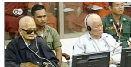
图：农谢（左）与乔森潘出庭受审

共产党相比，中共对人民犯下的罪恶有过之而无不及。1949年建政后运动不断，今天又迫害法轮功。他说：“这次判决也说明一个问题，任何犯罪者，不管年岁多大或犯罪时间过去了多久，一定会受到审判的。这也印证了一句古话叫善恶有报。”◇