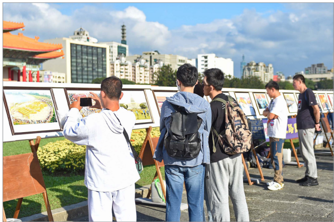
台北自由广场，游客了解法轮功真相。