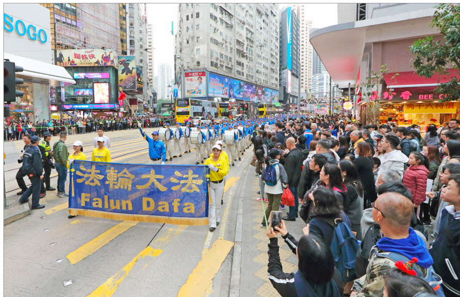
香港法轮功学员在“国际人权日”前夕大游行，呼吁制止中共迫害法轮功。