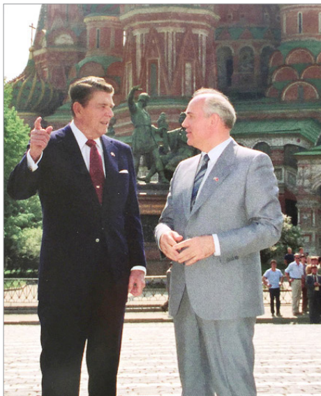
里根 1988 年应邀访苏，与戈尔巴乔夫在莫斯科红场大教堂前畅谈。1991 年，戈尔巴乔夫宣布苏共解体。