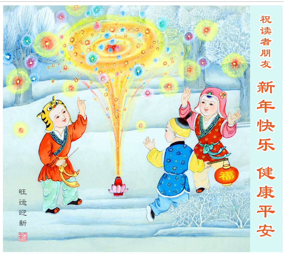
明慧年画《旺运迎新》