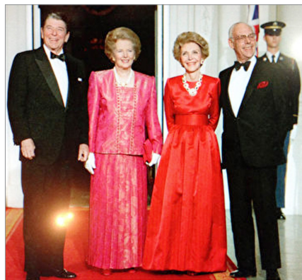
里根总统伉俪（左一、左三）问候好朋友英国首相撒切尔夫人伉俪（1988 年 11 月 16 日）